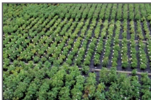
Sélection de plants de pomme de terre

tags : pomme de terre | sélection | clone