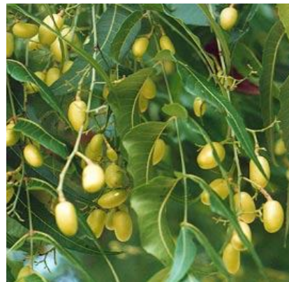
Le neem (Azadirachta indica)

On distingue parmi les produits qui peuvent être utilisés :